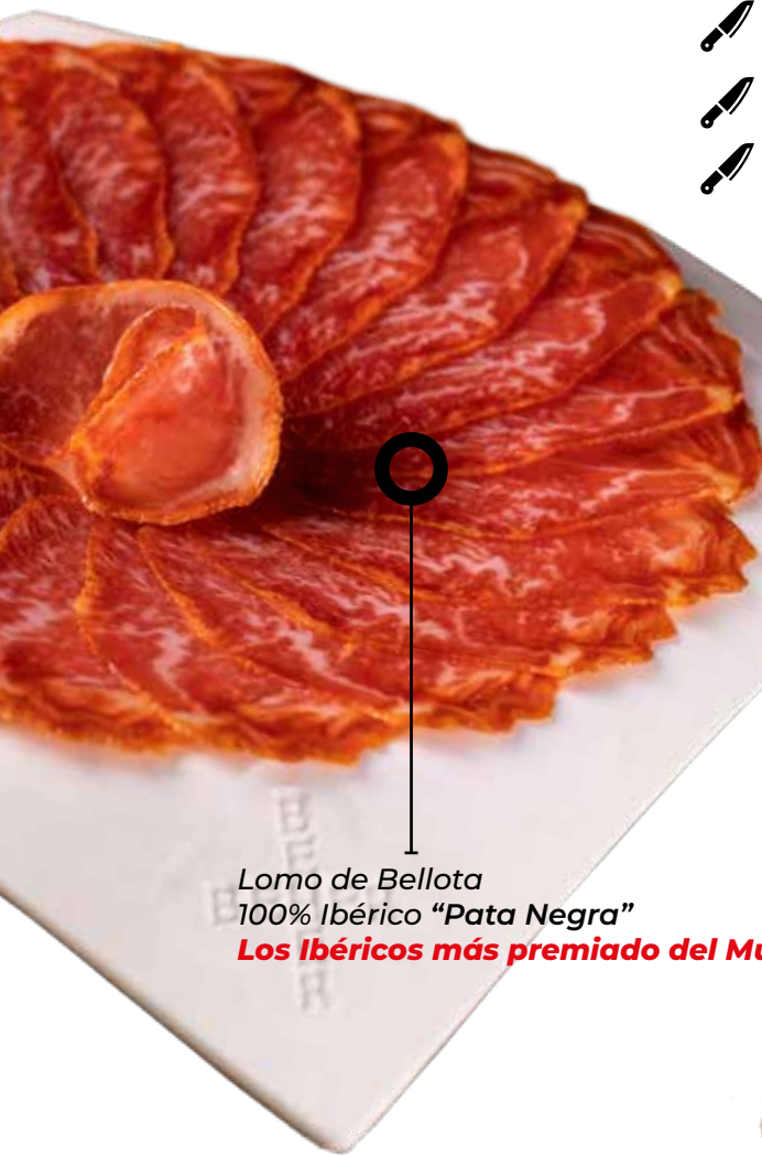
Lomo de Bellota 100% Ibérico "Pata Negra" Los Ibéricos más premiado del Mundo