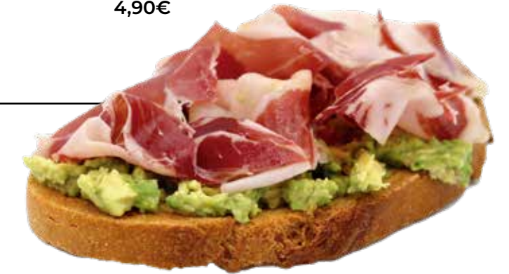
Tosta Guacamole con PALETA 100% IBÉRICA