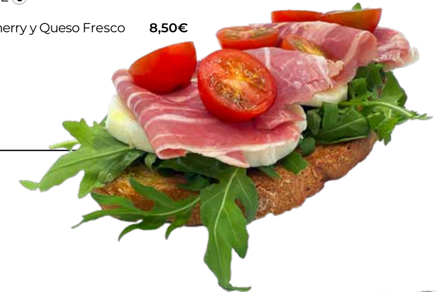
Tosta Vegetal con JAMÓN COCIDO 100% IBÉRICO