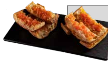
Pan Cristal 3,50€ Crujiente pan con aceite de oliva BEHER y tomate natural ideal para acompañar todos tus platos 100% Ibéricos