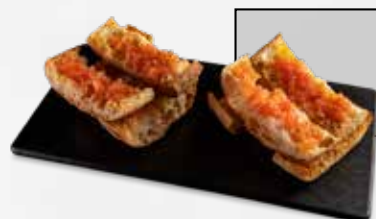
Pan Cristal 3,00€ Crujiente pan con aceite de oliva BEHER y tomate natural ideal para acompañar todos tus platos 100% Ibéricos