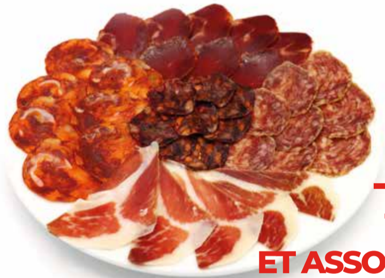
TABLEAU ET ASSORTIMENTS

TOUTES NOS TABLEAUX SONT SERVIES AVEC BATTONNES