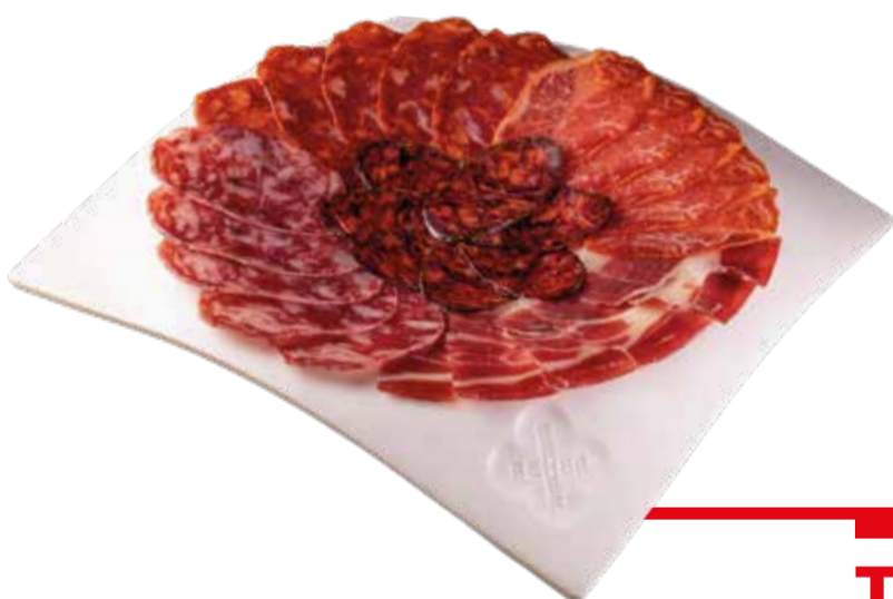
TABLEAU ET ASSORTIMENTS

TOUTES NOS TABLEAUS SONT SERVIES AVEC BATTONNES